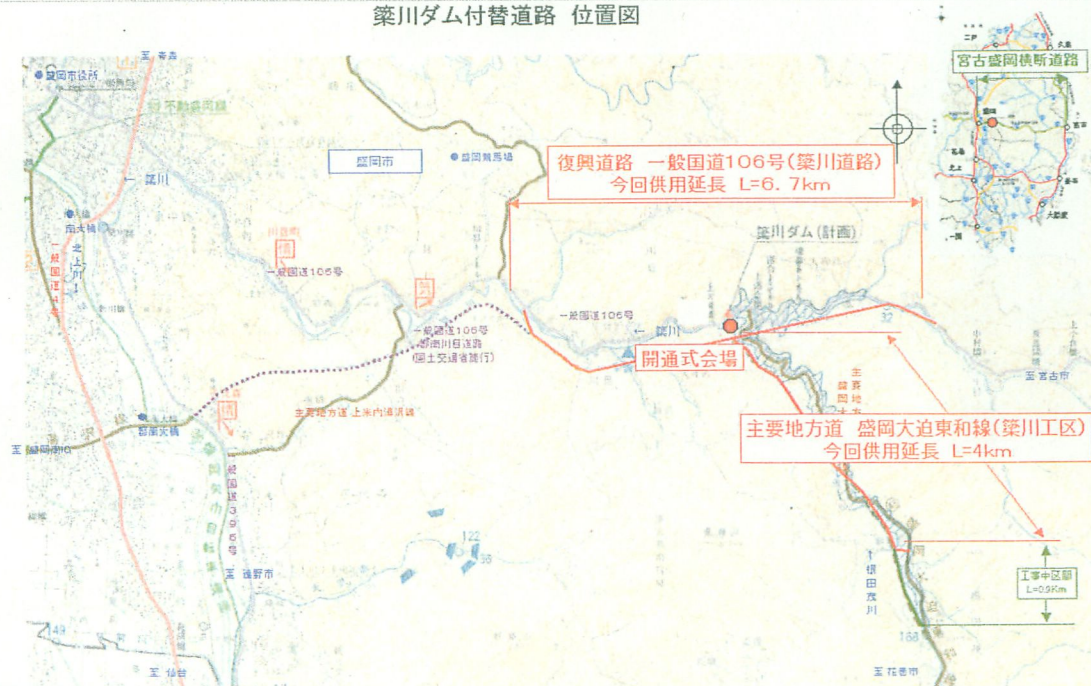
築川ダム付替道路 位置図