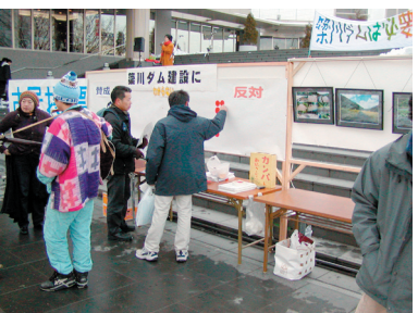
築川ダムについての市民投票 (03. 1. 19) 賛成 4% 反対 73% わからない 23% 市民の声のほとんどは建設反対でした。

そして失われる自然の価値は計りしれません。築川ダム取水事業が無駄であるだけでなく、財政的にも無理な事業であることは明らかです。即刻の中止を求めて活動しますので、署名運動に御協力ください。