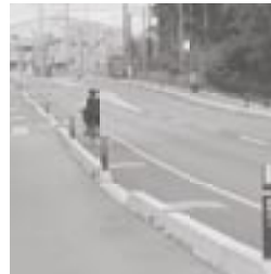
自転車走行レーンで安全快適