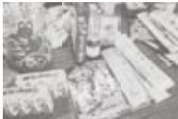
フードバンクに寄せられた食品の数々