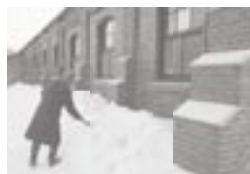
青山雪あかりの準備