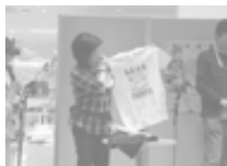
チャリティーオークションで司会