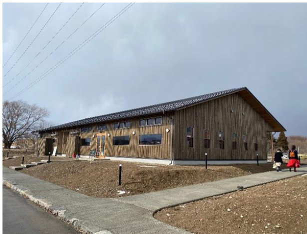
外観イメージ (写真は BeBA TERRACE 飲食棟)