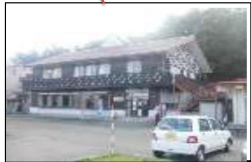
都南つどいの森レストハウス（廃止）