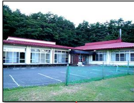
都南老人福祉センター（移転）