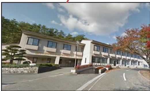
都南サイクリングターミナル（廃止）