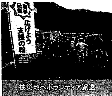
被災地へボランティア派遣

遠隔地から訪れる災害ボランティアを受け入れ、送迎、ボランティアニーズとのマッチングなどを行う拠点施設。市が宮古市川井地区にある県立宮古高等学校旧川井校校舎を借り受けて設置しました。瓦礫撤去、泥出し、河川海岸清掃、仮設住宅でのサロン活動支援、写真洗浄・整理などの活動にボランティアを派遣しましたが、平成25年3月をもってその役割を終え閉所しました。開所から閉所までの延べ利用者数は、宿泊者13,597人、活動者が15,273人となっています。