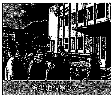
被災地視察ツアー