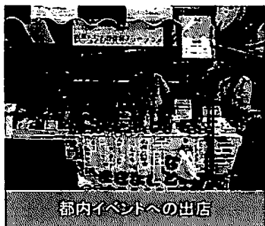
都内イベントへの出店

平成27年3月の閉所までの間、復興関連情報の発信のほか、三陸支援品販売等のイベント活動を126回、首都圏企業のCSR活動 ※5 等との連携を38回、首都圏と沿岸被災地のマッチング支援を46回、沿岸被災地の視察企画を10回、サロン等による首都圏避難者の支援を24回行いました。