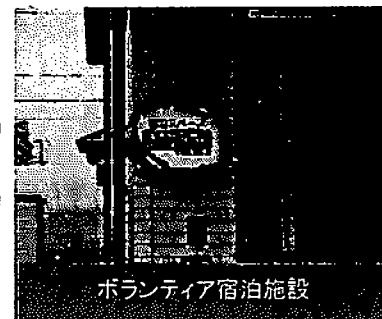
ボランティア宿泊施設