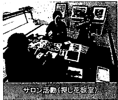
サロン活動(押し花教室)