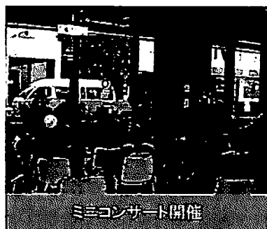
ミニコンサート開催