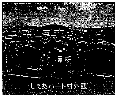
しまあハート村外観