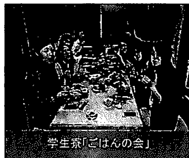
学生寮「ごはんの会」