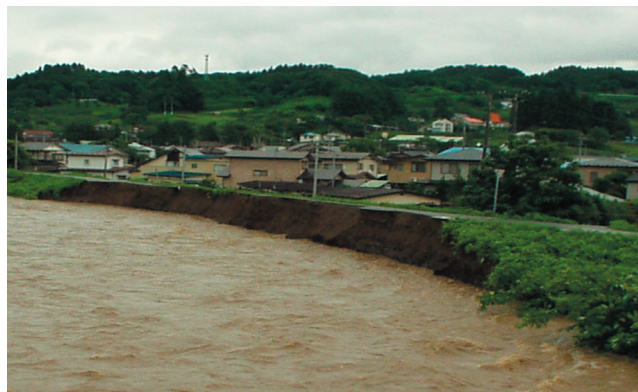
台風6号。築川ダムができて流れる水量以下で堤防は侵食された。

一昨年、台風6号の豪雨によって築川と北上川の合流地点付近で堤防が浸食され、一部崩れたのは記憶に新しい事だと思います。県の築川ダム事業計画の資料によればこの地点の流下能力は毎秒約800トンあるはずだったのに、毎秒335トンの水量で崩れかけてしまったのです。堤防はその後修復されましたが、今のままで本当に大丈夫なのでしょう