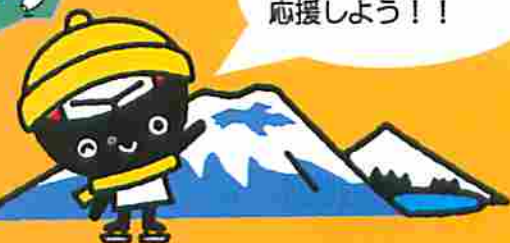
冬季大会盛岡ご当地バージョン「岩手山・姫神山+とふっち」