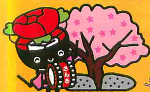
盛岡ご当地バージョン「石割桜+さんさ踊りとふっち」