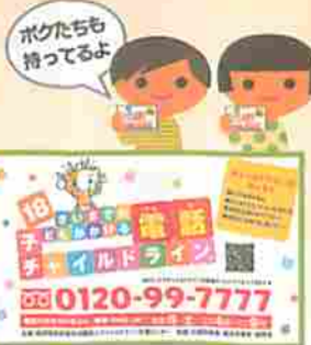
子どもたちに配布しているカード