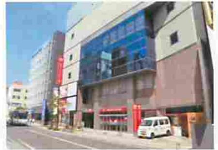
子育て応援プラザ開設予定地 第8大通ビル3階（大通一丁目9-12）